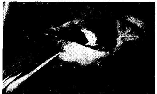
Abb. 2 und 3: Lasurmeise vom Neusiedlersee.