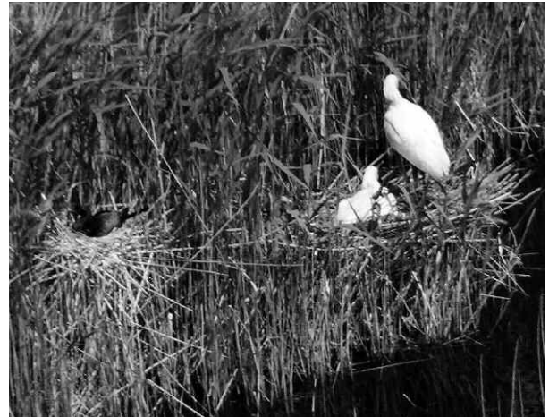
Abb. 1: Zwergscharbe am Nest am 8. Mai 2007, siehe zum Größenvergleich die beiden adulten Löffler rechts davon.

Im Untersuchungsjahr 2007 wurden bereits beim ersten von insgesamt fünf Flügen am 17. April 12 Nester der Zwergscharbe entdeckt. Sie lagen in unmittelbarer Nachbarschaft zu Silberreiher oder Löffler in einer großen Reiherkolonie, in der außerdem auch noch Graureiher und Seidenreiher ( Egretta garzetta ) brüteten (Abb. 1). Beim nächsten Flug am 8. Mai wurden noch zwei weitere Nester mit brütenden Altvögeln lokalisiert. An den folgenden Flugterminen am 18. Mai und 13. Juni konnten in acht Nestern 1–5 Junge identifiziert werden. Das Schicksal der anderen Nester konnte aufgrund eingeschränkter Sicht nicht geklärt werden. Zwergscharben brüten 27–30 Tage (Cramp & Simmons 1977), der Eiablagetermin am Neusiedler See fiel daher vermutlich in die zweite oder dritte Aprilwoche. Die erste Beobachtung von Zwergscharben im Gebiet gelang beim Seebad Illmütz am 6. April 2007 (E. Albecker, C. Neger, G. Spreitzer u.a., schriftl. Mitteilung der Avifaunistischen Kommission von A. Ranner). Die Vögel dürften daher kurz nach ihrer Ankunft am Neusiedler See mit dem Brutgeschäft begonnen haben. Überraschenderweise wurden am 28. Juli noch fünf weitere Nester mit sitzenden Altvögeln entdeckt. Sie befanden sich in unmittelbarer Nachbarschaft der mittlerweile schon verlassen anderen Neststandorte. Da Zwergscharben nur einmal pro Saison brüten (Cramp & Simmons 1977), handelt es sich bei diesen Nestern höchstwahrscheinlich um Ersatzbruten nach Brutaussfällen oder um Neuzugänge.